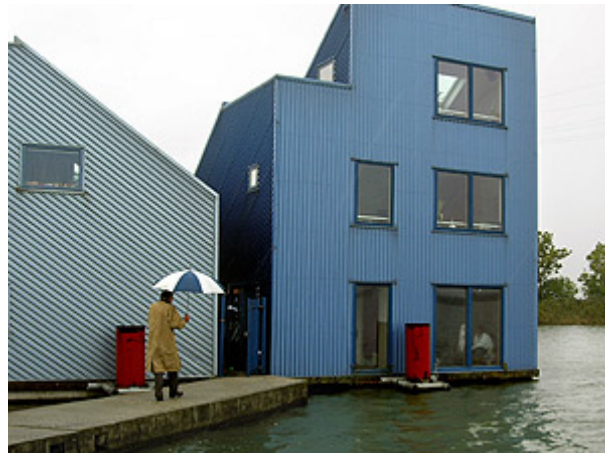
Figura 1 – Casa flutuante Maasbommel